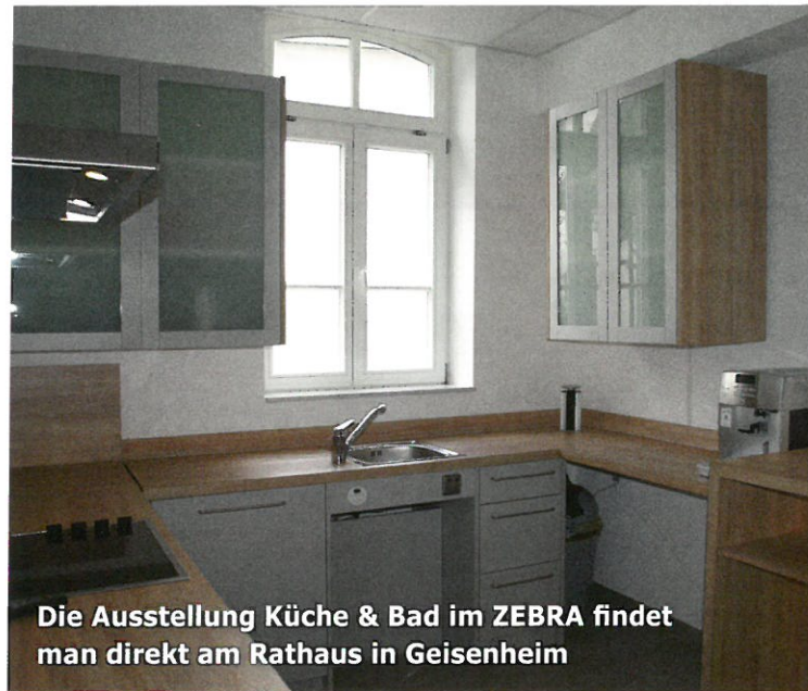
Die Ausstellung Küche & Bad im ZEBRA findet man direkt am Rathaus in Geisenheim

Die Räumlichkeiten werden für Fachveranstaltungen, als Ausstellungsfläche für Kooperationspartner, zu Vernetzungstreffen von ehrenamtlich Aktiven und für Qualifizierungen genutzt. Die Musterausstellung mit zahlreichen Demonstratoren und moderner Präsentationstechnik ermöglicht einen niedrighschwelligigen Zugang >>